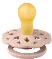
Größe 1 NATURKAUTSCHUK

Das runde, leichte Schild wölbt sich von der empfindlichen und sensiblen Haut um den Mund des Babys weg. So wird ein minimaler Kontakt mit der Nase und der Haut um den Mund des Babys gewährleistet. Dadurch kann sich weniger Feuchtigkeit aus dem Speichel ansammeln, was zu Ausschlägen und wunden Stellen führen kann. Das Schild ist in einer Einheitsgröße erhältlich, unabhängig von der Größe des Saugers. Der Sauger ist aus 100% natürlichem Naturkautschuk produziert. Da Naturkautschuk ein natürliches Material ist, können Farbvariationen auftreten.