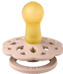
Größe 2 NATURKAUTSCHUK