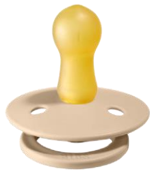
Größe 2 NATURKAUTSCHUK