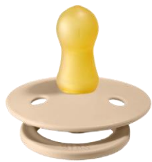
Größe 1 NATURKAUTSCHUK

Das runde und sehr leichte Schild wurde sorgfältig entworfen, damit es sich weg von der empfindlichen und zarten Mundhaut biegt, um den Kontakt mit der Nase und dem Mund des Babys zu minimieren. Damit reduziert sich das Risiko für Hautirritationen und rote Haut durch Sabbern. Das Schild hat immer dieselbe Größe, egal wie groß der Sauger ist. Dieser Schnuller ist auch in einer Nachtversion mit einem im Dunkeln leuchtenden Handgriff erhältlich. Der Sauger ist aus 100% natürlichem Naturkautschuk produziert. Da Naturkautschuk ein natürliches Material ist, können Farbvariationen auftreten.