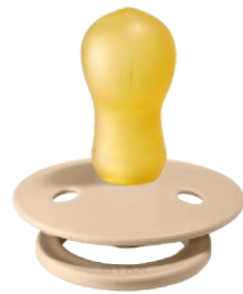
Größe 3 NATURKAUTSCHUK